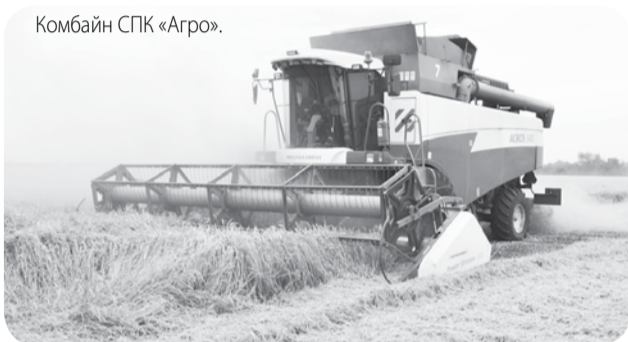
Комбайн СПК «Агро».

В Предгорном округе готовятся убрать озимые зерновые на площади 36,9 тыс. га, при этом пшеница занимает порядка 30 тыс. га, остальное - ячмень.