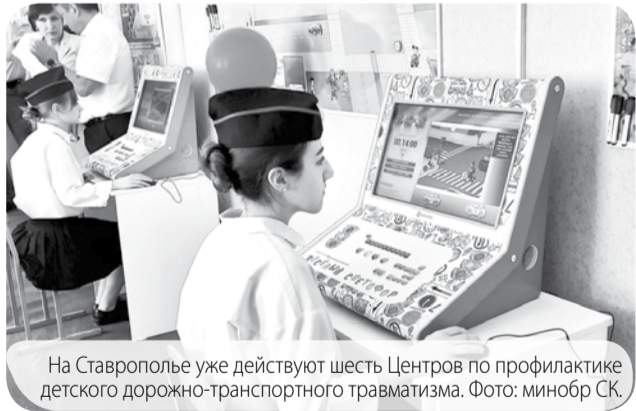
На Ставрополье уже действуют шесть Центров по профилактике детского дорожно-транспортного травматизма.

На Ставрополье открыли ещё два Центра по профилактике детского дорожно-транспортного травматизма.